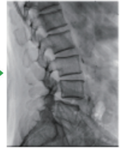
ダイナミック処理