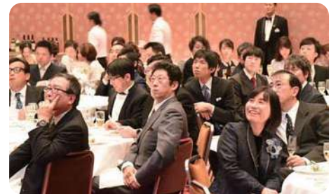
当院整形外科の歴史を紹介したスライドを楽しむ参加者