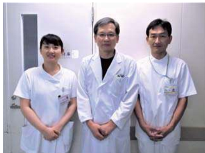
早期離床・リハビリテーションメンバー