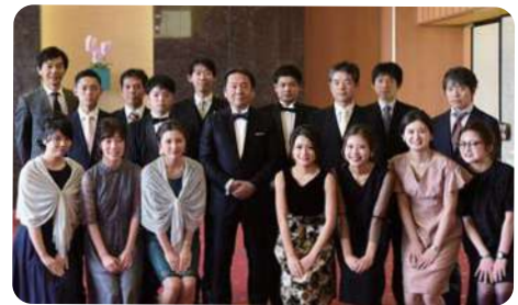
脊椎手術1万件突破記念受付スタッフ一同

会を企画したものとしては、参加者それぞれが神戸医療センター整形外科診療に関わったこと、関わっていることに誇りを感じ、旧交を温め、また日常業務の息抜きをし、それが明日からの仕事へのモチベーション向上につながっていただければ幸いです。