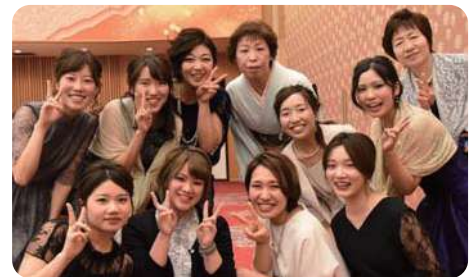
4東 整形外科病棟スタッフ