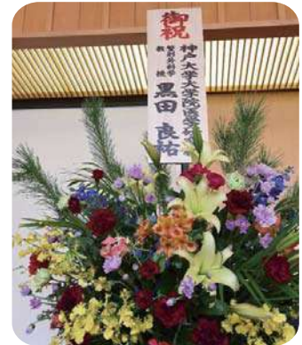
当院OB、神戸大学整形外科黒田良祐教授より