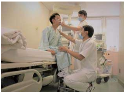
人工呼吸器患者のリハビリ風景