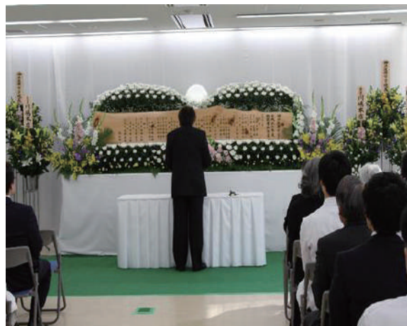
参列者1人ひとりが祭壇に献花しました