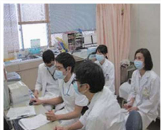
「抗菌薬適正使用についてのカンファレンスの様子」

感染防止対策加算2取得の地域医療機関と年4回合同カンファレンスを開催し、共に感染管理についての知識・技術が向上できるように取り組んでいます。また感染防止対策加算1取得の地域医療機関と相互ラウンドによる感染対策実施状況の確認を行い、より良い感染対策が実施できるように切磋琢磨しています。