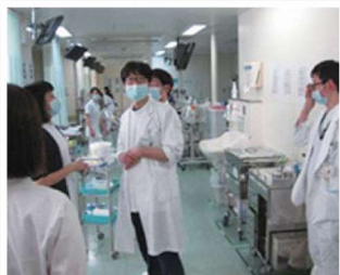
「各部署をラウンドして環境チェック」