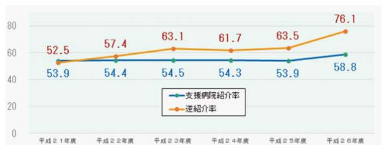
2. 紹介件数の推移 (過去5年間)