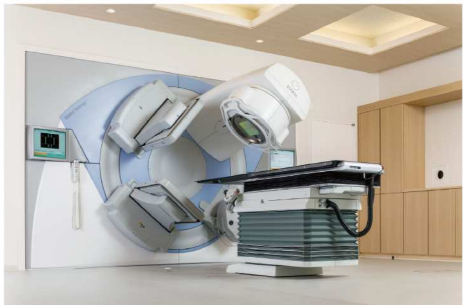
エレクトラ社製 シナジー IGRT(image-guided radiotherapy)対応