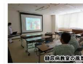
糖尿病教室の風景