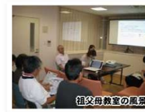
祖父母教室の風景